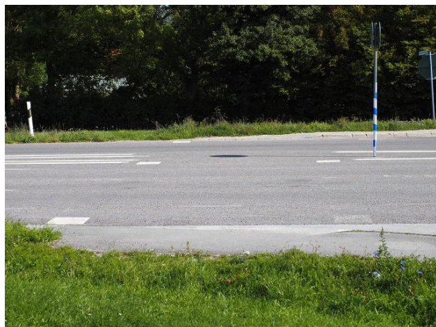
Var är den målade refugen?

I texten i programmet talas det även om en "målad refug" men i så fall förstår vi inte hur en sådan ser ut.