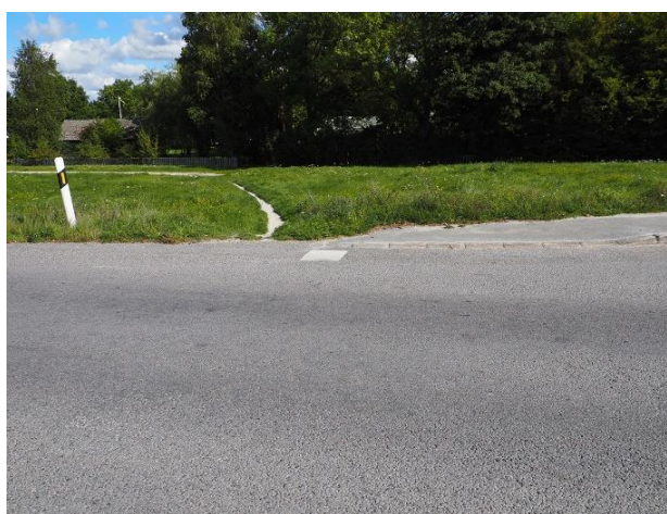
Hårdgjord gångstig fram till väg 140

Det finns inte heller någon särskild vägledning eller några markeringar för cyklister vid korsningen eller anvisningar/rekommendationer före korsningen från något håll. För den som kommer till korsningen på stigen från nordost finns det ingen plats att stanna och bilda sig en uppfattning av trafiksituationen innan man är ute på vägbanan.