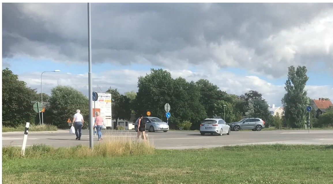
Fotgängarpassage på odefinierat, självvalt ställe i korsningen väg 140/Verkstadsgatan-Hamnvägen

Väg 140 utgör vid sin passage av Klintehamn idag en mycket påtaglig barriär som boende och besökare har att korsa. Det rörigaste och mest trafikerade stället utgörs av fyrvägskorsningen som via Verkstadsgatan och Hamnvägen förbinder samhällets centrala delar med de många besöksmålen i hamnområdet – t.ex. hamnkaféet, bastun, småbåtshamnen, gästhamnen, Karlsöbåten, husbilsupplagningsplatserna och gångbron som leder vidare mot pensionat Varvsholm och promenadrundan ”Varvet runt”.